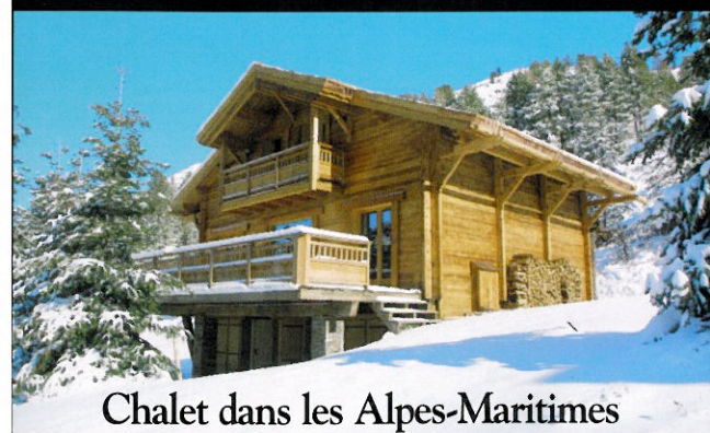
Chalet dans les Alpes-Maritimes

LE PLUS GRAND CHOIX DE BELLES MAISONS ET DE BEAUX APPARTEMENTS