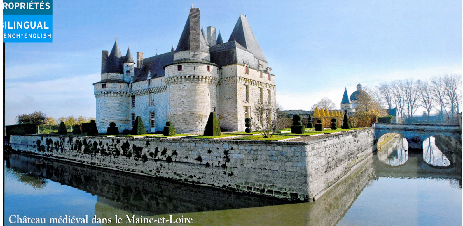
Château médiéval dans le Maine-et-Loire