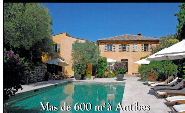
Mas de 600 m 2 à Antibes