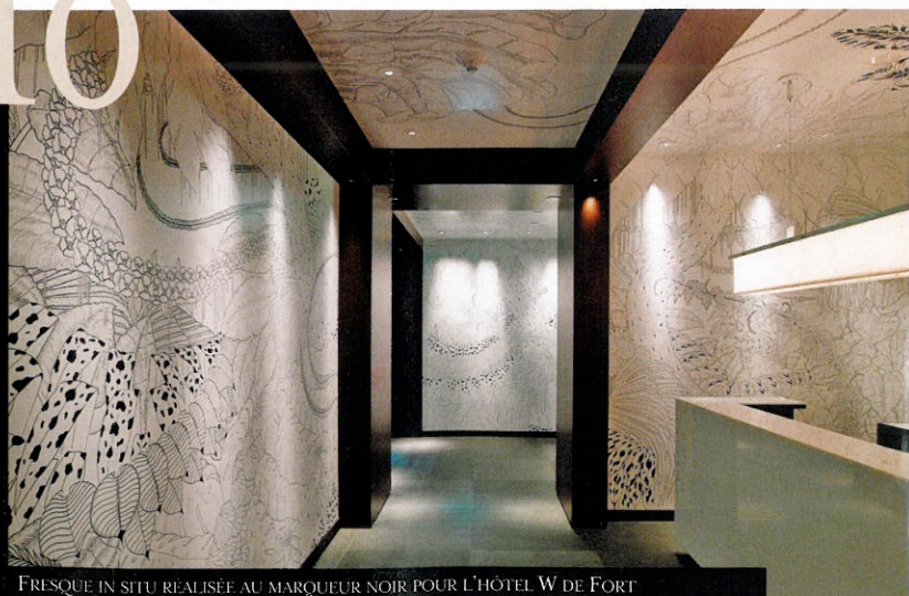
FRESQUE IN SITU RÉALISÉE AU MARQUEUR NOIR POUR L'HÔTEL W DE FORT