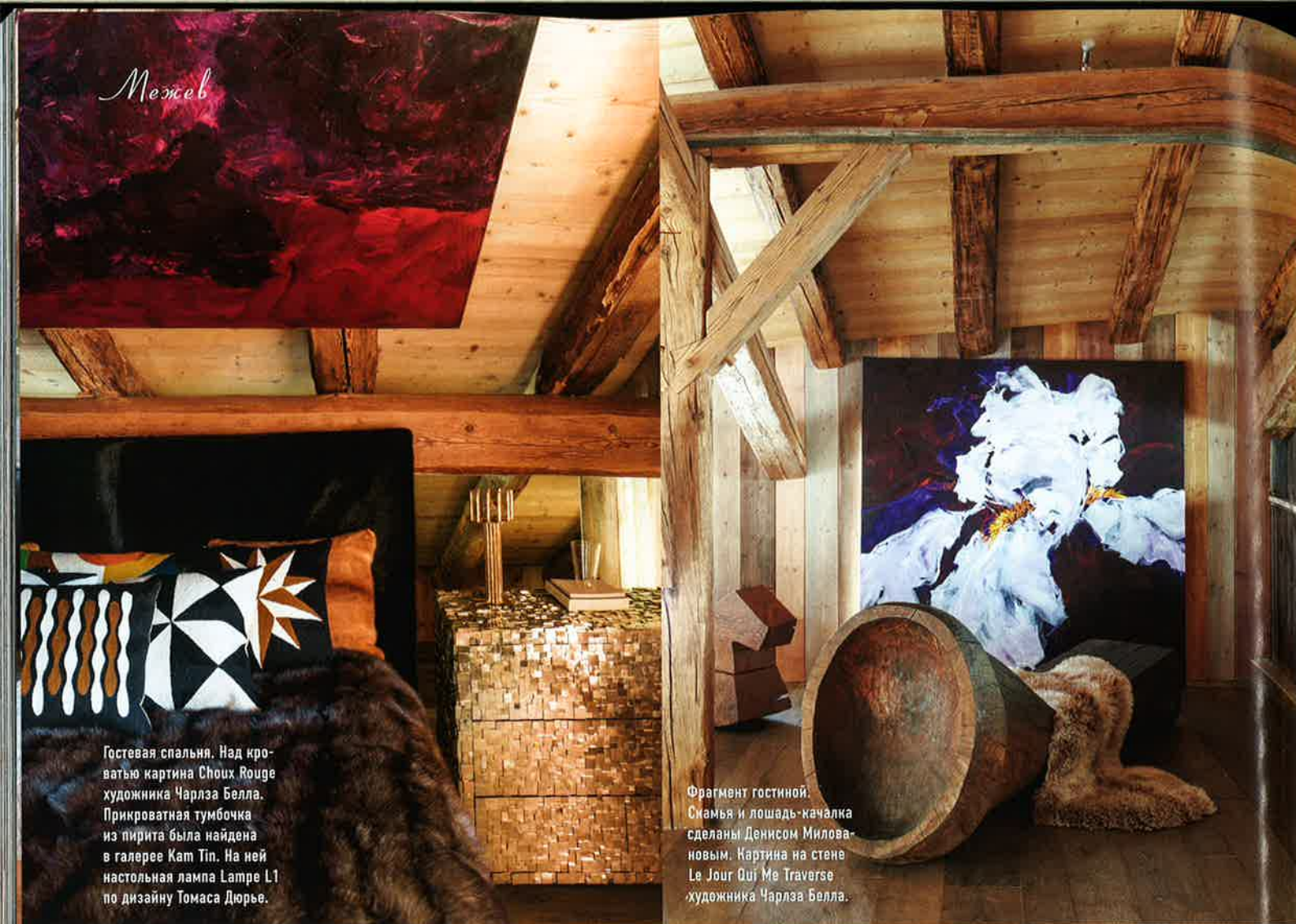
Гостевая спальня. Над кроватью картина Choux Rouge художника Чарльза Белла. Прикроватная тумбочка из пирита была найдена в галерее Kam Tin. На ней настольная лампа Lampe L1 по дизайну Томаса Дюрье.