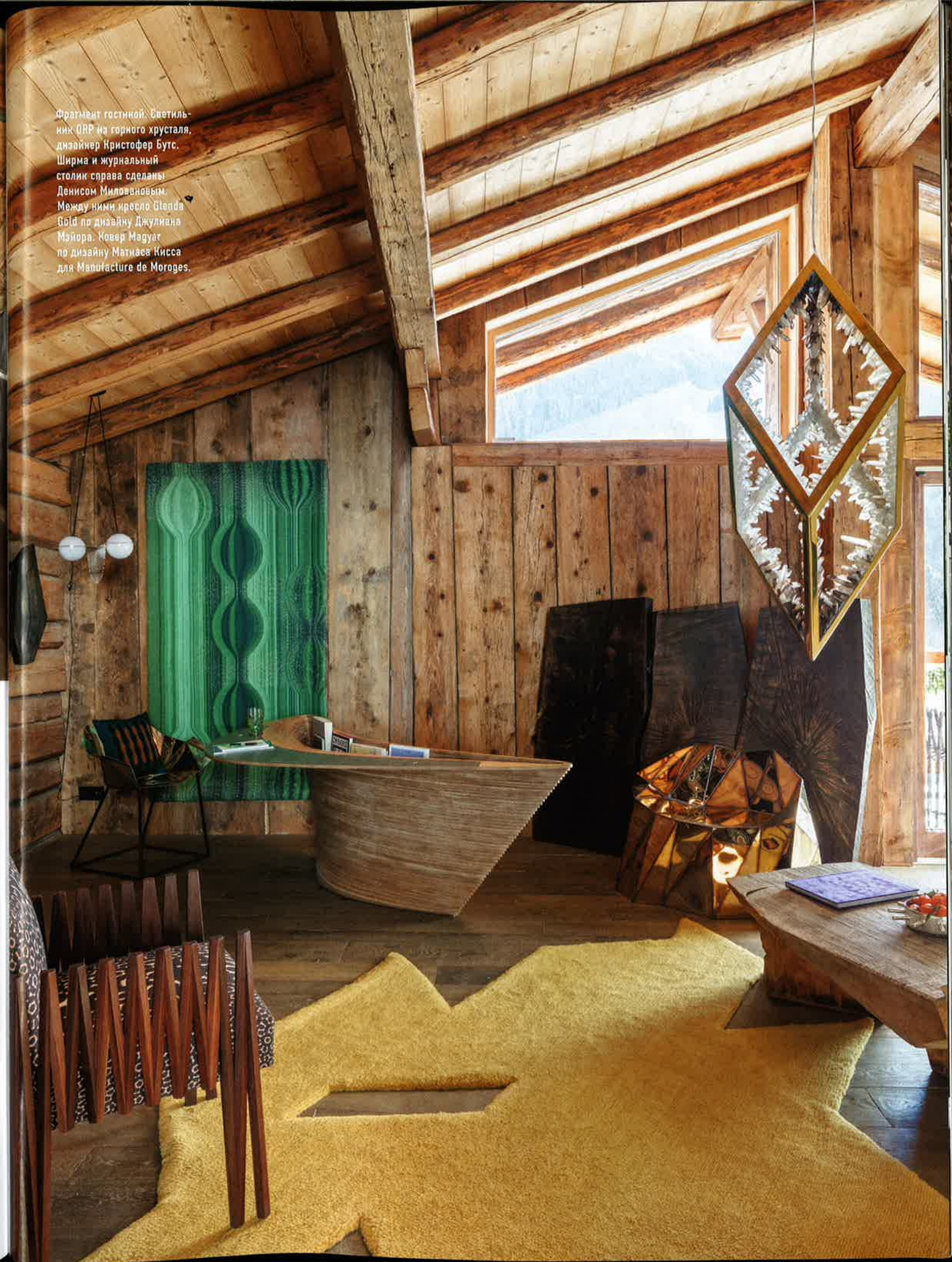
Фрагмент гостиной. Светильник ORP из горного хрусталя, дизайнер Кристофер Бутс. Ширма и журнальный столик справа сделаны Денисом Миловановым. Между ними кресло Steada Gold по дизайну Джулиана Мэйора. Ковер Maguar по дизайну Матиаса Кисса для Manufacture de Moroges.