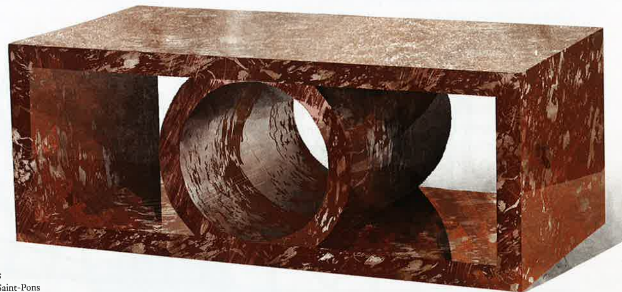
Table basse Palais Marbre rouge de Saint-Pons (L. 120 x l. 45 x h. 60 cm).