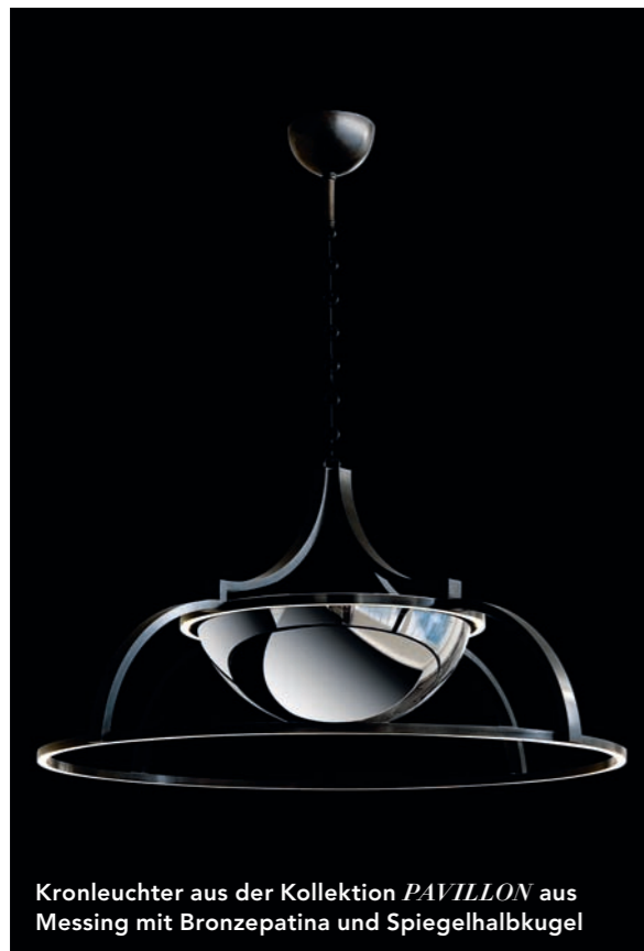
Kronleuchter aus der Kollektion PAVILLON aus Messing mit Bronze- und Spiegelpatina und Spiegelhalbkugel