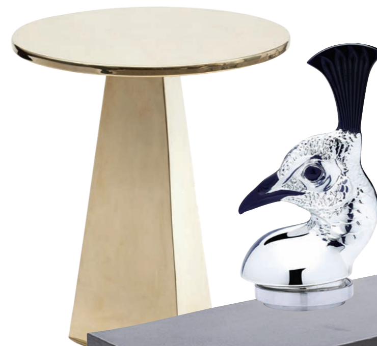
Skulptur der Kollektion CURIOS aus Kristallglas für Lalique