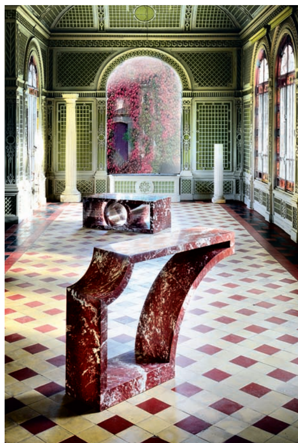
COFFEETABLE und KONSOLE aus rotem Marmor für die Pariser Galerie Armel Soyer