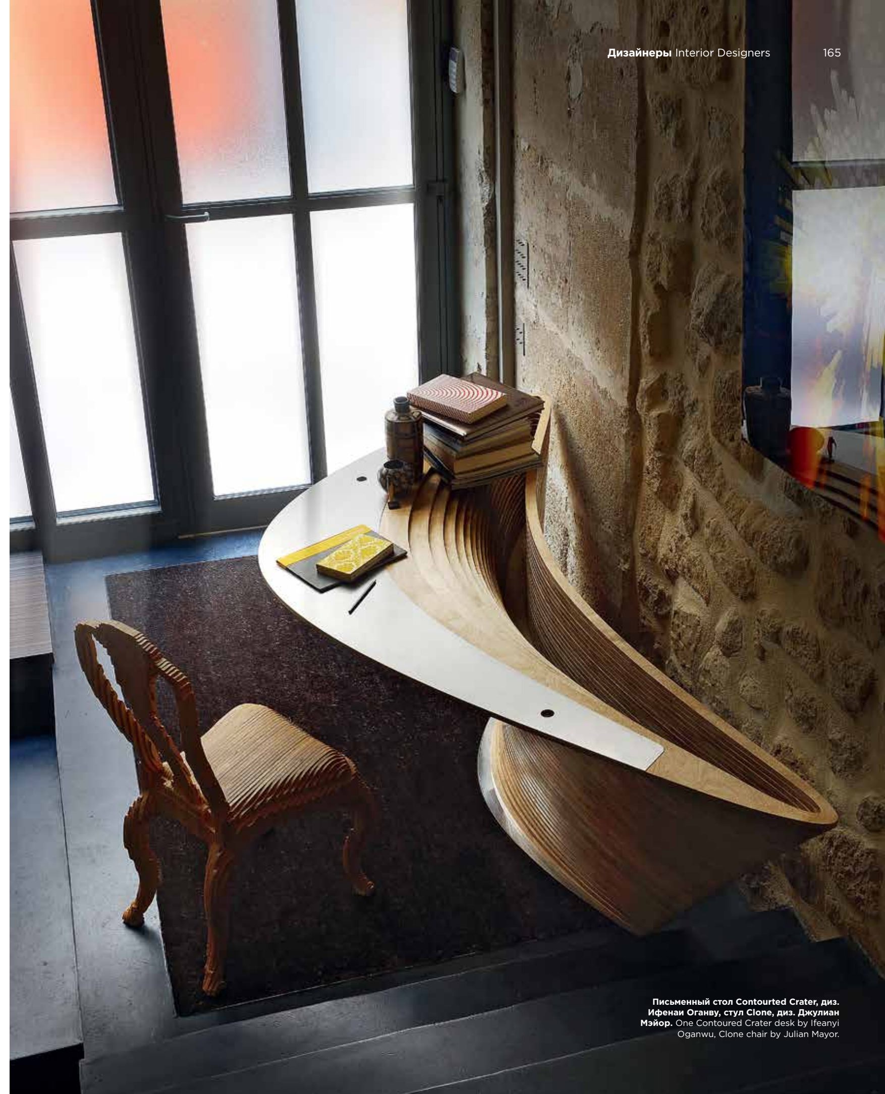
Письменный стол Contoured Crater, диз. Ифенаи Оганву, стул Clone, диз. Джулиан Мэйор. One Contoured Crater desk by Ifeanyi Oganwu, Clone chair by Julian Mayor.