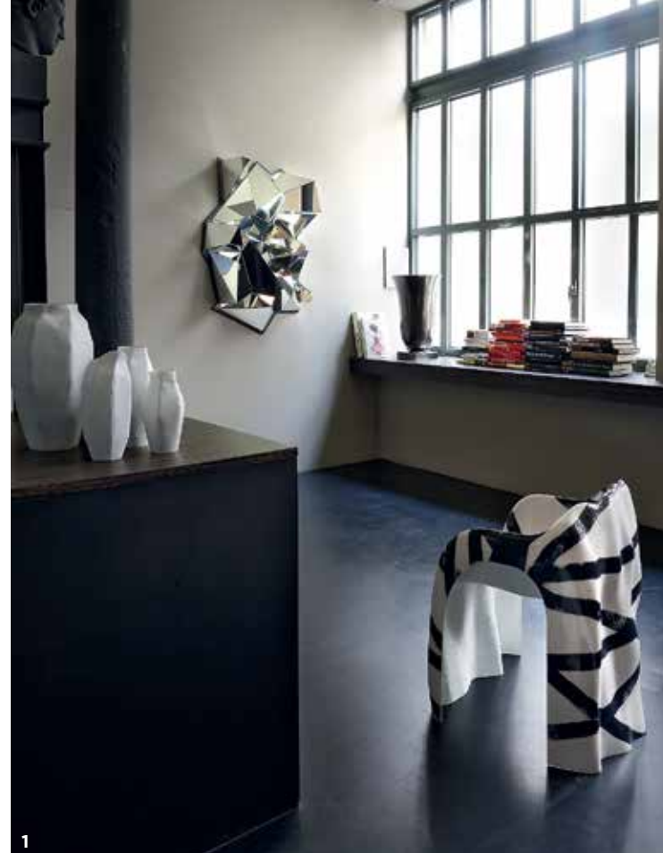
1. Кресло Strata, диз. Джулиан Мэйор. Стекловолокно и карбоновая лента. 2. Вид из гостиной на второй уровень. 3. Черный бетонный пол. Диван Igloo, диз. Матиас Кисс. Мраморные столики, диз. Ифенаи Оганву. Froisse Mirror#2, диз. Матиас Кисс. Стол Ren, диз. Ифенаи Оганву. Каррарский мрамор. Вазы, колл. Nymphenburg, диз. Рут Гурвич. 1. Strata chair by Julian Mayor. Fiberglass and carbon ribbon. 2. View from the living space to the upper level. 3. Black concrete floor. Igloo sofa by Mathias Kiss. Marble table by Ifeanyi Oganwu. Froisse Mirror#2 by Mathias Kiss. Carrara marble table. Ren by Ifeanyi Oganwu. Ceramic vases from the serie Nymphenburg by Ruth Gurvich.